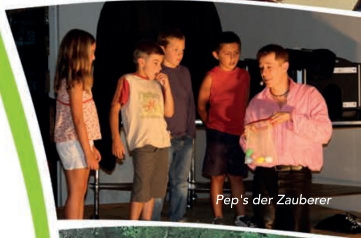
Pep's der Zauberer